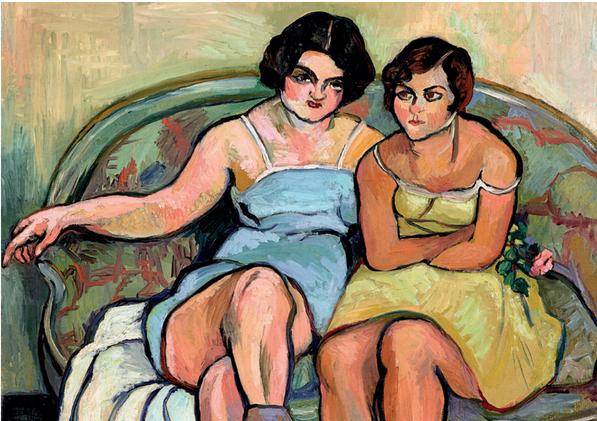
Suzanne Valadon, Les Deux Sœurs (détail), 1928, huile sur toile, collection particulière.

Après Metz et Nantes, le Centre Pompidou consacre l'une de ses dernières expositions avant sa fermeture à cette figure de la peinture parisienne active jusque dans les années 1930 et qui a ignoré les grands courants de l'art moderne.