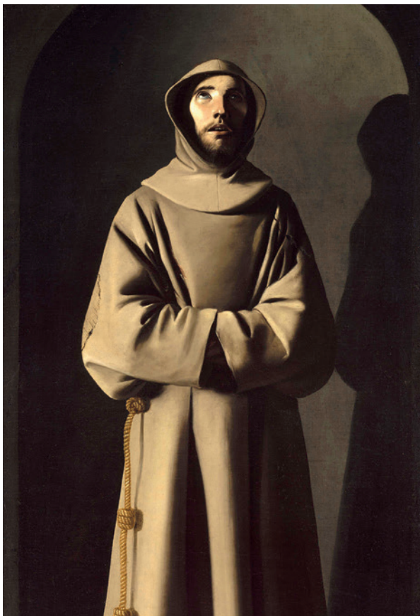
À g., Jusepe de Ribera, Saint Barthélemy, 1612, huile sur toile, Fondation Roberto Longhi, Florence. À dr., Francisco de Zurbarán, Saint François d'Assise, vers 1640-1645, huile sur toile, Museum of Fine Arts, Boston.

Le Petit Palais à Paris et le Musée des beaux-arts de Lyon exposent respectivement Ribera et Zurbarán, deux éminents représentants du Siècle d'or espagnol inspirés par le clair-obscur du Caravage. Les partis pris scénographiques sont cependant très différents.