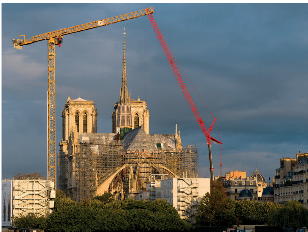
La cathédrale Notre-Dame de Paris, fin novembre 2024.

Pour importante qu'elle soit, la réouverture de la cathédrale est seulement la première étape d'un chantier qui devrait durer plusieurs années encore, concernant tant l'édifice que ses abords : parvis, square, berges de la Seine.