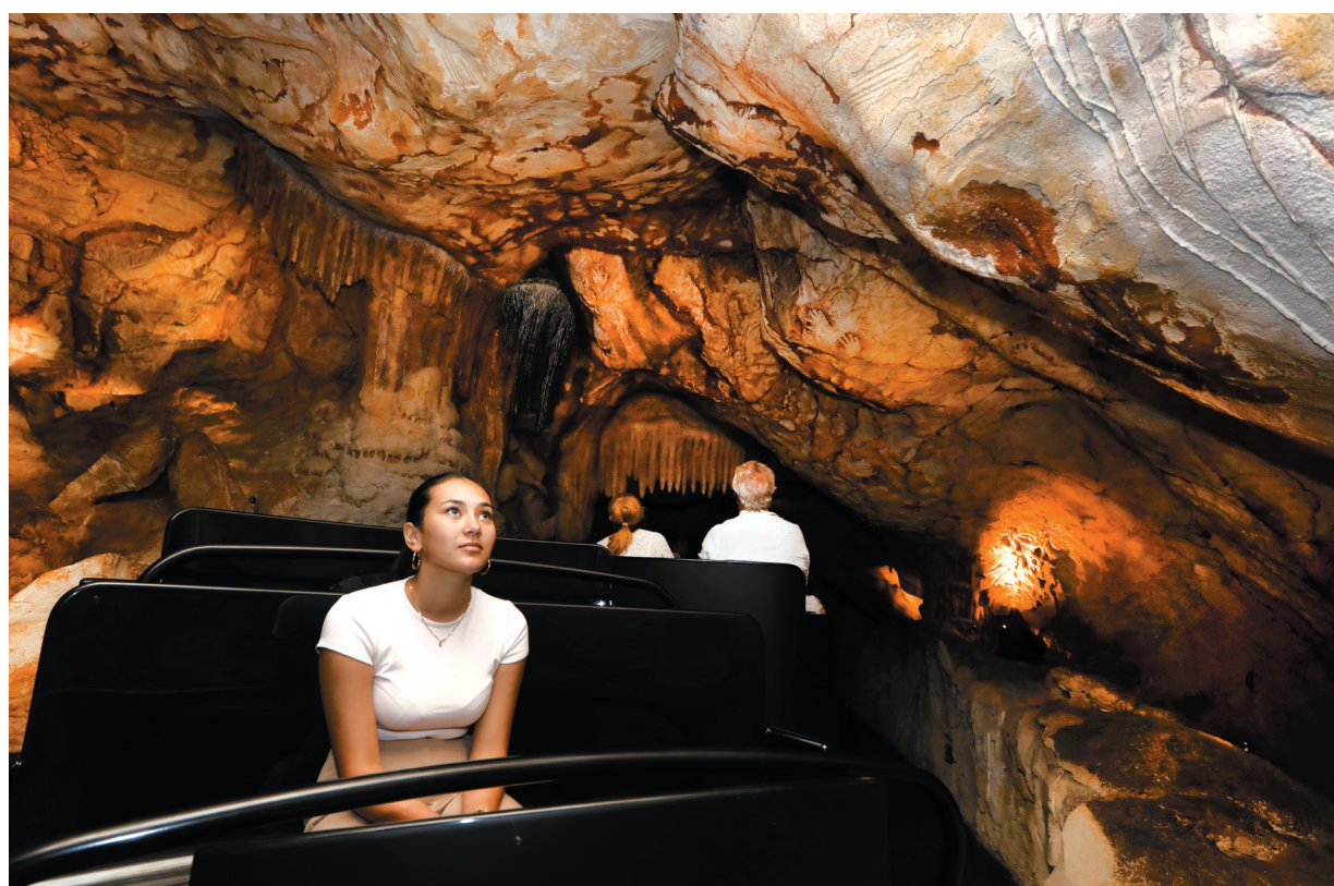
Visite de la réplique de la grotte Cosquer à la villa Méditerranée.

Trente ans après la découverte de la grotte ornée dans le massif des Calanques, Marseille inaugure une réplique dans un bâtiment existant près du MuCEM. Ce fac-similé immersif s'inscrit à la suite de Lascaux II et IV, et de Chauvet II dans lesquelles la qualité des reconstitutions est récompensée par un large succès public.