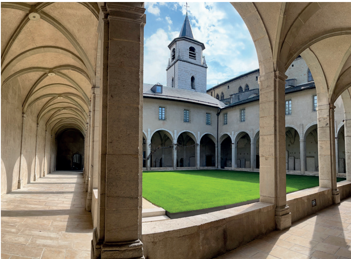
Le cloître du Musée savoisien.

Après huit années de fermeture pour cause de travaux, le musée de Chambéry vient de rouvrir. Il veut renouveler l'image d'un musée d'arts et traditions populaires pour offrir un regard moderne sur la Savoie.