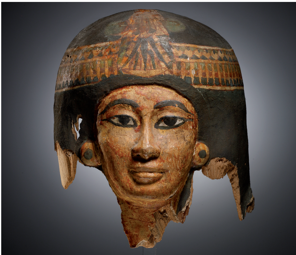
Masque de momie d'une femme, Égypte, Nouvel Empire (XX e dynastie), vers 1100-1050 av. J.-C., bois, H. 27 cm.

En marge de La Biennale Paris à l'étoile pâissante, les marchands parisiens, regroupés pour certains au sein de Parcours des mondes, lancent la saison avec une volonté d'optimisme.